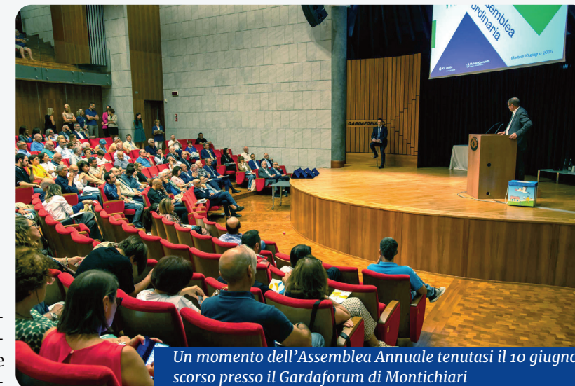
Un momento dell'Assemblea Annuale tenutasi il 10 giugno scorso presso il Gardaforum di Montichiari